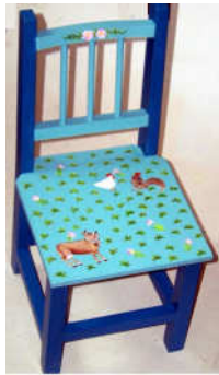
TELETHON 2010- Chaise 010