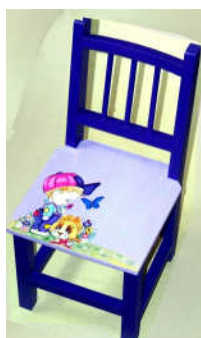
TELETHON 2010- Chaise 020 H 47 cm