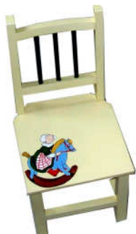
TELETHON 2010- Chaise 040 H: 47 cm