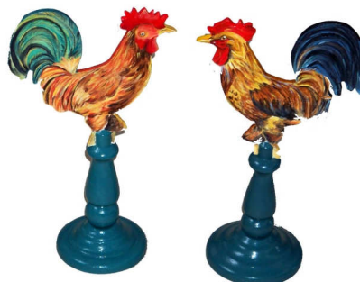
TELETHON 2010 Coqs 010 et 020