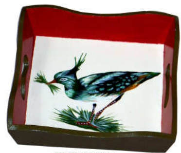
TELETHON 2010- Petit plateau 010