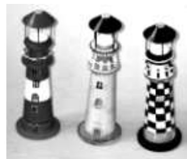
TELETHON 2010 Piments 010 à 030