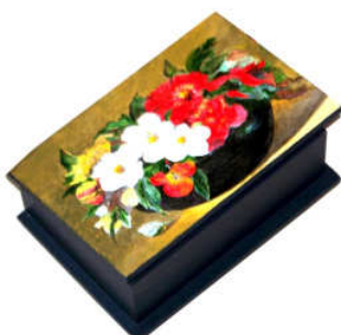
TELETHON 2010 Boîte à sucre 020