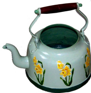
TELETHON 2010 Bouilloire 010