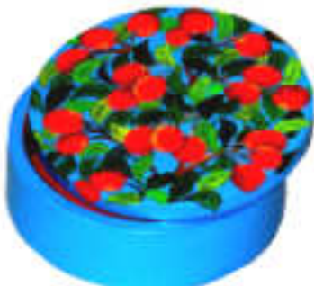
TELETHON 2010 Bambouline bois peinte 020