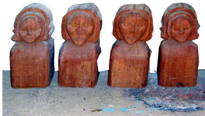
Les blochets de l'église de Laz Les quatres évangélistes