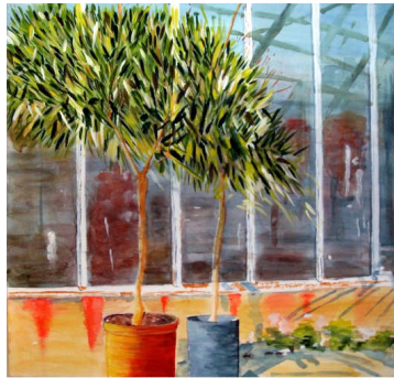
TELETHON 2010 Tableau 040