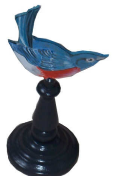
TELETHON 2010 Oiseau 090