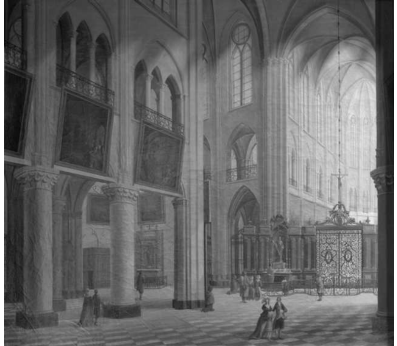
Nef de Notre Dame au 18 ième siècle, avec ses « Mays » accrochés

La plupart de ces oeuvres ont retrouvé leur musée d'origine et les « Mays » peuvent être admirés à Arras, dans une salle qui leur est consacrée. L'inventaire officiel ayant partiellement disparu, celui fait par Guillou a facilité la restitution de nombreux objets. L'inventaire des réserves du musée de Quimper, commencé en 2006, pourrait en identifier d'autres que l'on pense perdus en Allemagne.