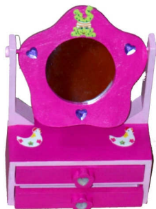
TELETHON 2010 Coiffeuse de poupée