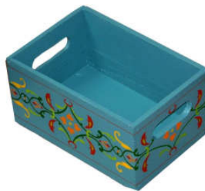
TELETHON 2010 Coffre rangement 010