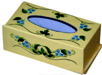
TELETHON 2010 Boîte à mouchoirs 030