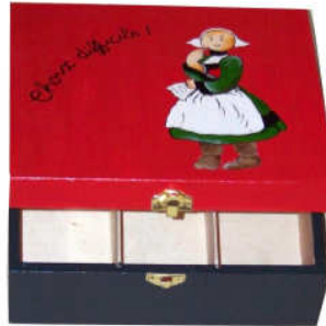
TELETHON 2010 Boîte à thé 010