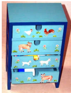
TELETHON 2010- Meuble à tiroir 010