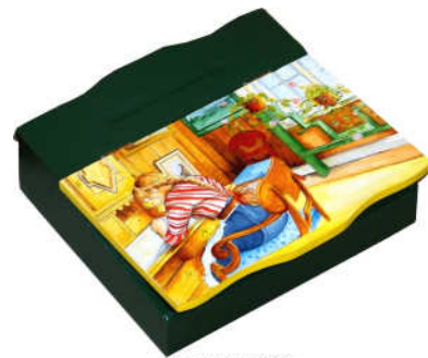
TELETHON 2010 Grand ecritoire 040