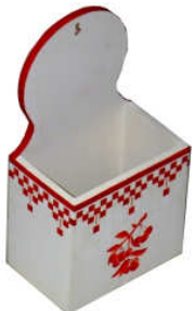
TELETHON 2010 Boîte à sel 030