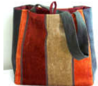
TELETHON LAZ 2010 Sac 030 Sac original fait main