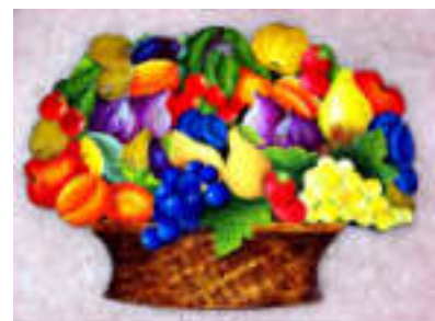
TELETHON 2010 Décoration 010 Peintre Au Fruit