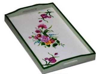
TELETHON 2010 Grand plateau 010