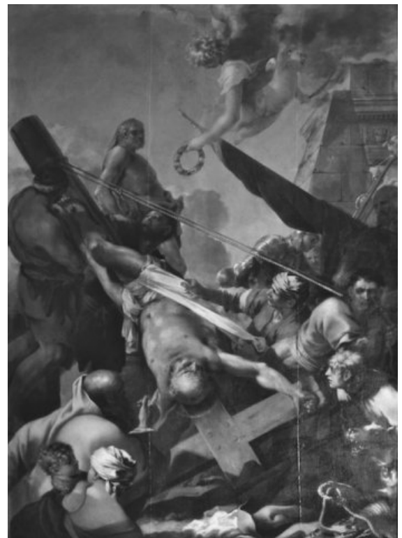
Un des « Mays » les plus célèbres : Le Crucifiement de Saint-Pierre (1643) de Sébastien Bourdon