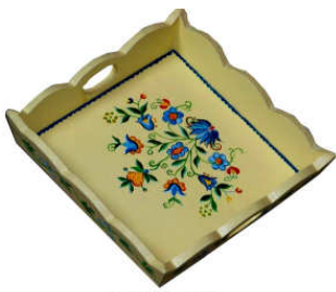
TELETHON 2010- Petit plateau 040

Vous pouvez voir la galerie complète et en couleurs sur www.lazaloeil.com , onglet LAZ