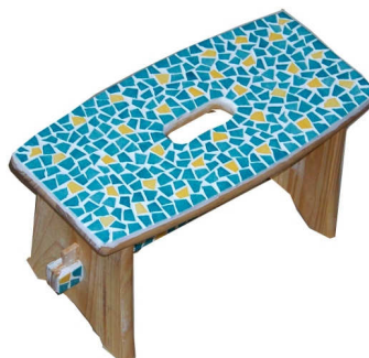
TELETHON 2010 Tabouret 010 (H: 22cm, L: 39 cm, l: 19 cm)