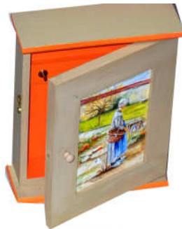
TELETHON 2010 Armoire à clefs 010

Vous pouvez voir la galerie complète et en couleurs sur www.lazaloeil.com , onglet LAZ