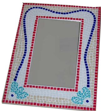
TELETHON 2010 Glace 040