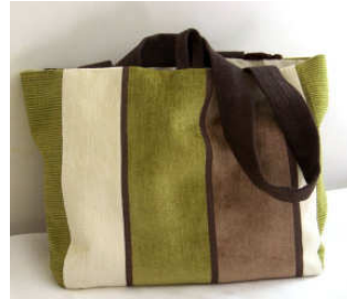
TELETHON LAZ 2010 Sac 020 Sac original fait main