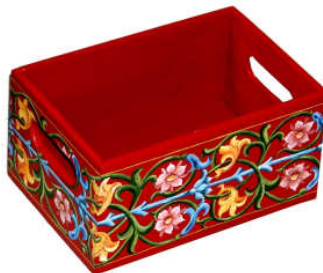
TELETHON 2010 Coffre rangement 020