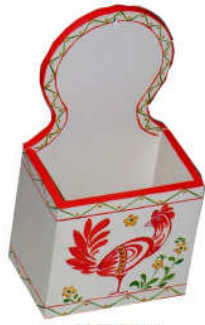
TELETHON 2010 Boîte à sel 010