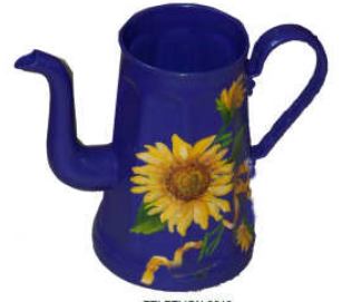
TELETHON 2010 Cafetière de ferme 010