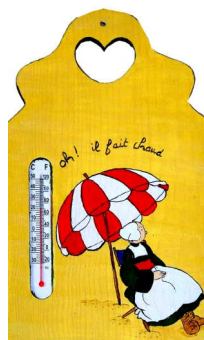
TELETHON 2010 Thermomètre 010