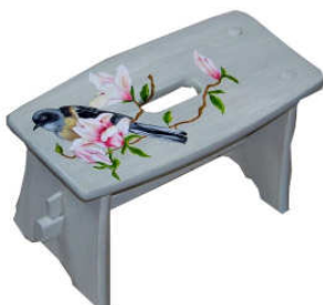
TELETHON 2010 Tabouret 010 (hauteur 22cm, L 39, l 19 cm)