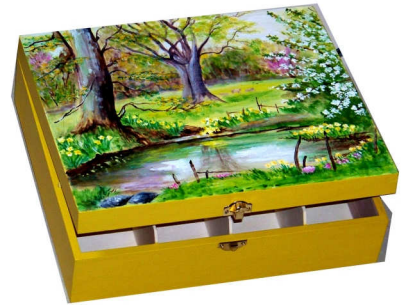
TELETHON 2010 Boîte à thé 030