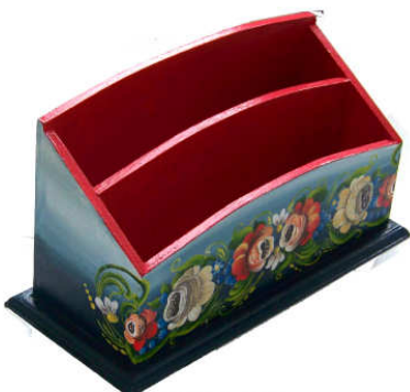
TELETHON LAZ 2011 RCOUR060 - Range courrier