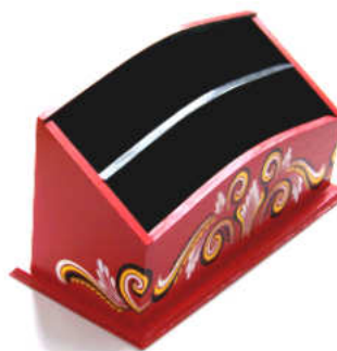
TELETHON LAZ 2011 RCOUR020 - Range-courrier