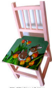
TELETHON LAZ 2011 CH020- Chaise pour enfant "Les petits lapins"