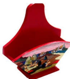
TELETHON LAZ 2011 DIV120- Boîte à filtres