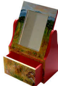
TELETHON LAZ 2011 COIF010- Petite coffeuse