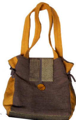
TELETHON LAZ 2011 SAC010 - Grand sac mode (recto)