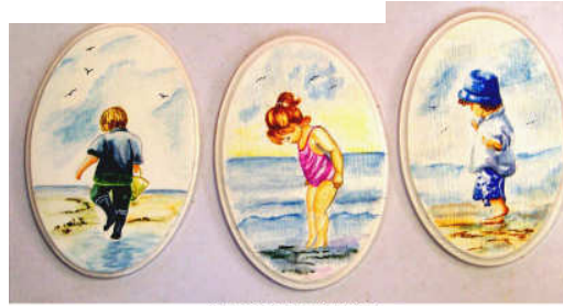
TELETHON LAZ 2011 PTABL100 à PTABL120 - Petits tableaux