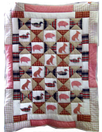
TELETHON LAZ 2011 DIV240 - Plaid