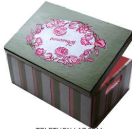
TELETHON LAZ 2011 COF120- Coffret