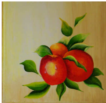
TELETHON LAZ 2011 PTAB1150 - Petit tableau