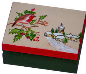
TELETHON LAZ 2011 COF160 - Petite boîte