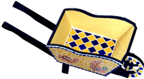
TELETHON LAZ 2011 DIV150 - Brouette décorative mosaïque