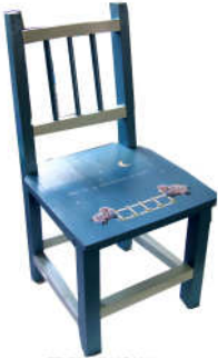
TELETHON LAZ 2011 CH010- Chaise pour enfant "Pour toi, je décrocherai la lune"