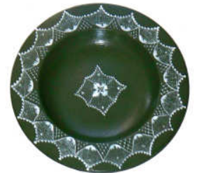
TELETHON LAZ 2011 COUP020 - Coupelle en bois peint