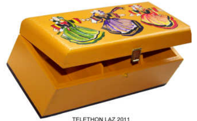
TELETHON LAZ 2011 COF090 - Petit coffre à thé