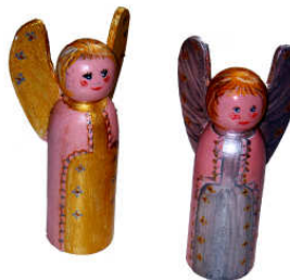
TELETHON LAZ 2011 DIV090 - Anges