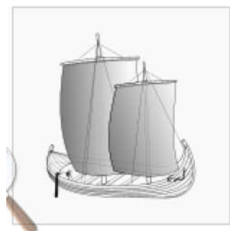
Reconstitution d'un navire vénète à deux mâts