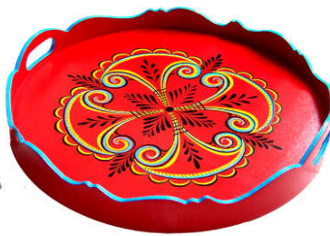
TELETHON LAZ 2011 PLAT040 - Plateau rond