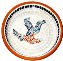
TELETHON LAZ 2011 COUP030 - Grande coupelle mosaïque