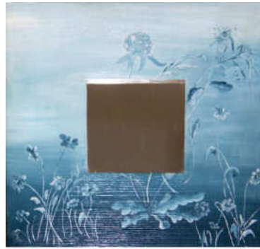
TELETHON LAZ 2011 MIR010 - Miroir