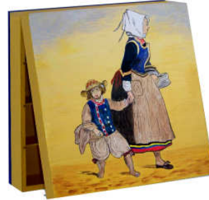
TELETHON LAZ 2011 COF150 - Grand coffre à thé