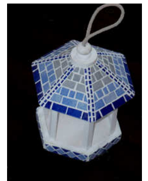
TELETHON LAZ 2011 DIV180 - Lanterne en mosaïque