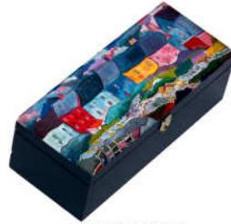
TELETHON LAZ 2011 COF030 - Petit coffre à thé