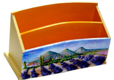
TELETHON LAZ 2011 RCOUR040 - Range courrier