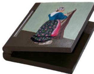
TELETHON LAZ 2011 DIV010- porte-carnet