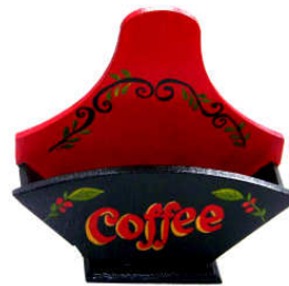
TELETHON LAZ 2011 DIV130- Boîte à filtres