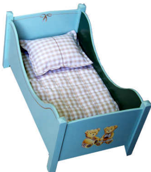
TELETHON LAZ 2011 DIV260 - Grand lit de poupée