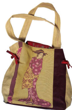
TELETHON LAZ 2011 SAC020 - Grand sac mode