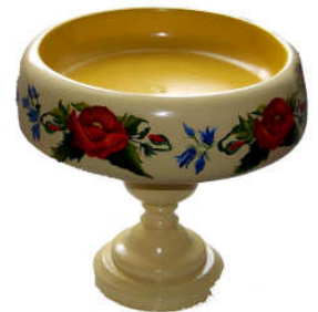
TELETHON LAZ 2011 DIV070- Coupe à fruits en bois peint