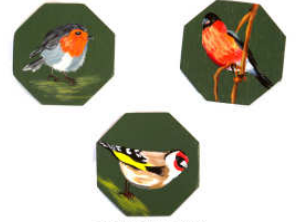
TELETHON LAZ 2011 PTABL040 - Petits lavieurs