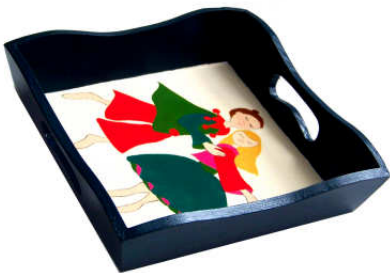
TELETHON LAZ 2011 PLAR030 - Plateau moyen