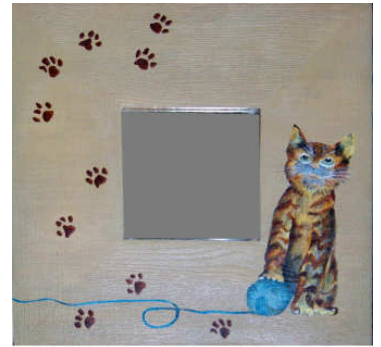
TELETHON LAZ 2011 MIR020 - Miroir