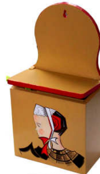
TELETHON LAZ 2011 DIV060- Boîte à sel avec couvercle