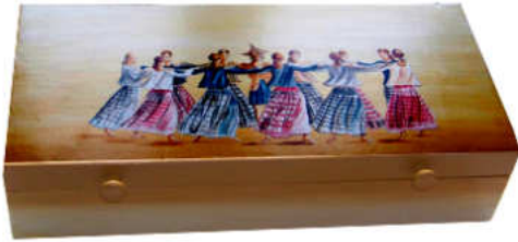
TELETHON LAZ 2011 COF130 - Grand coffret