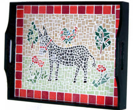
TELETHON LAZ 2011 PLAT020 - Grand plateau mosaïque