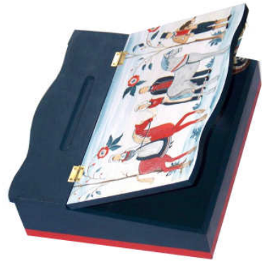
TELETHON LAZ 2011 ECRIT010 - Ecrivoire grand modèle