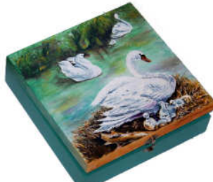
TELETHON LAZ 2011 COF170 - Grand coffre à thé