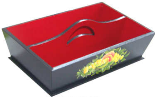
TELETHON LAZ 2011 PAN040 - Panier à couverts