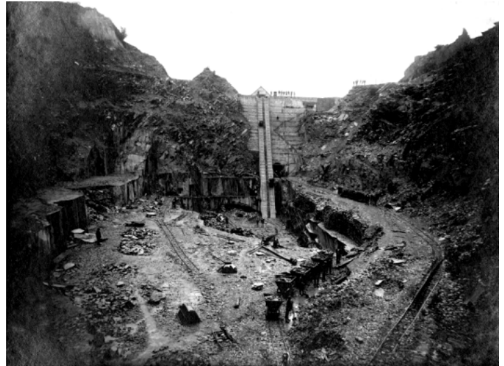
Vue du front de taille. début 1920

Il a fallu que des gendarmes mobiles interviennent pour arrêter les sauvages affrontements entre les Parisiens et les ouvriers de la carrière, aidés de ceux venus de Rosporden et Châteaulin pour réagir à cette provocation. Il y avait eu des batailles rangées dans les bois, les fossés, à coup de matraques et de cannes. Les Camelots avaient été rossés, mais l'un des combattants disait avoir vu Yann emmené, inconscient, par un groupe en direction des bois de Kerwoazec et ne plus jamais l'avoir revu depuis. S'était-on débarrassé de son corps dans la carrière pour éviter les questions et le scandale?