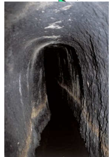
intérieur de l'aqueduc de Carhaix (27 kms de long)