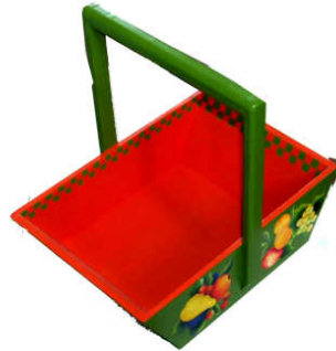
TELETHON LAZ 2012 PAN120- Panier en bois peint