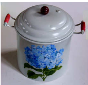
TELETHON LAZ 2012 Marmite peinte à la main