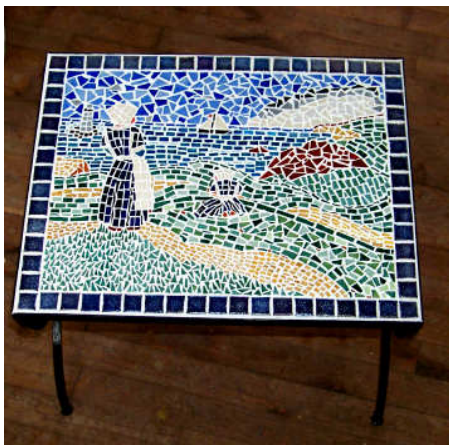
TELETHON LAZ 2012 Table basse céramique 010