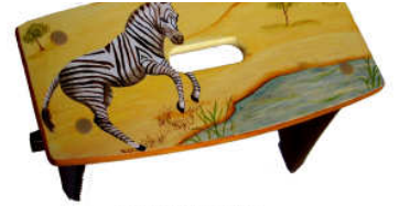
TELETHON LAZ 2012 TAB050 - Tabouret