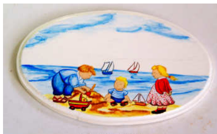
TELETHON LAZ 2012 PTABL200 Petit tableau