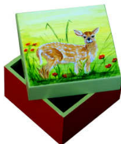
TELETHON LAZ 2012 COF 120 Coffret bois peint