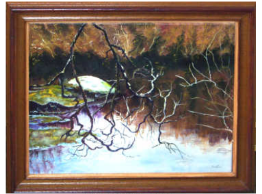
TELETHON LAZ 2012 61BL050 "La Mare au Diable"