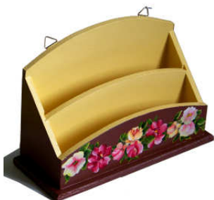
TELETHON LAZ 2012 RCOUR080 Range-courrier