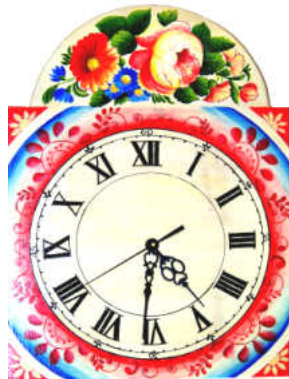
TELETHON LAZ 2012 HOR070- Horloge murale