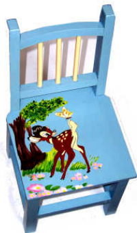
TELETHON LAZ 2012 CH050- Chaise pour enfant