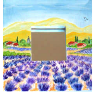
TELETHON LAZ 2012 Glacé 110