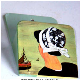
TELETHON LAZ 2012 Range lettres 060