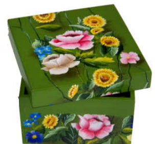
TELETHON LAZ 2012 Grande boîte de rangement 010