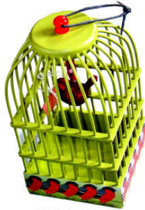
TELETHON LAZ 2012 Cage à oiseau 010