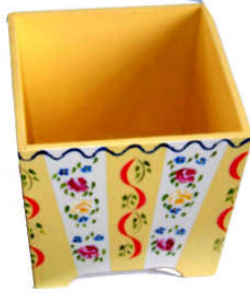
TELETHON LAZ 2012 Cache-pot 090