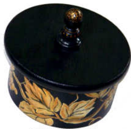
TELETHON LAZ 2012 Boîte à bijoux 030