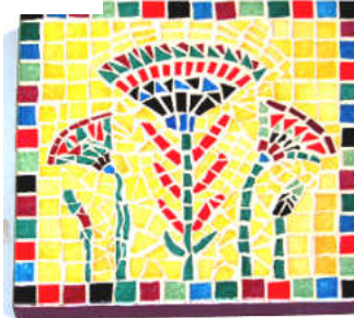
TELETHON LAZ 2012 Desous de plat 110