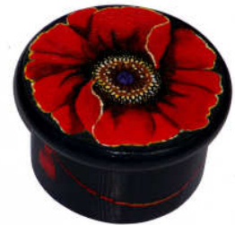
TELETHON LAZ 2012 Boîte à bijoux 040