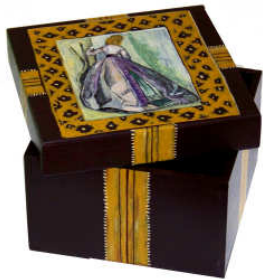
TELETHON LAZ 2012 Grande boîte de rangement 020