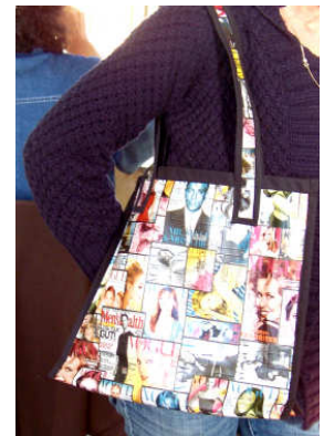
TELETHON LAZ 2012 SAC060 - Grand sac fantaisie