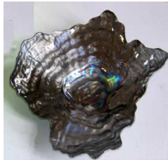
TELETHON L1Z 2012 Coupe à fruit en pâte de verre