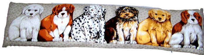
TELETHON LAZ 2012 Coussin bas de porte/canapé "La famille"