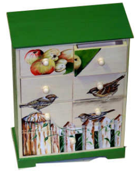
TELETHON LAZ 2013 Armoire de rangement