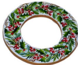
TELETHON LAZ 2013 Couronne traditionnelle