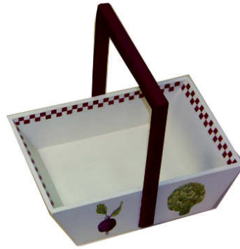
TELETHON LAZ 2013 Pănier