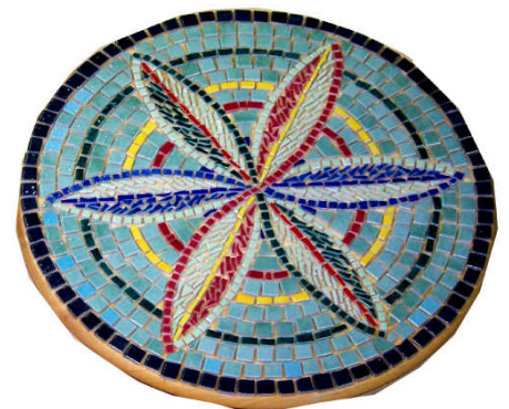
TELETHON LAZ 2013 Dessous de plat céramique