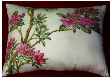
TELETHON LAZ 2013 Coussin