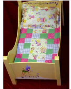
TELETHON LAZ 2013 Grand lit de poupée