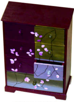
TELETHON LAZ 2013 Armoire de rangement