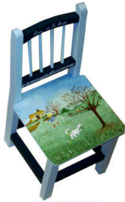
TELETHON LAZ 2013 Chaise enfant