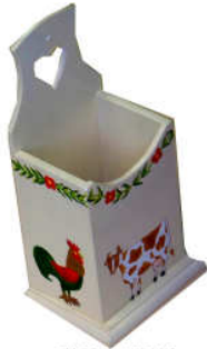
TELETHON LAZ 2013 Boîte à couverts