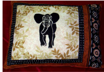
TELETHON LAZ 2013 Coussin