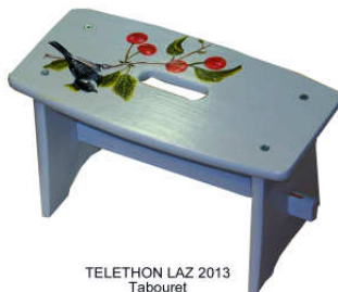
TELETHON LAZ 2013 Tabouret