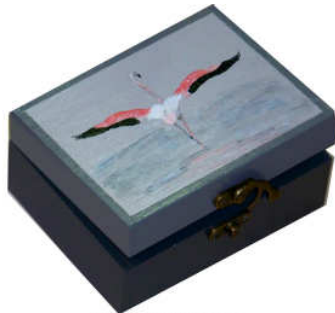
TELETHON LAZ 2013 Grand coffret