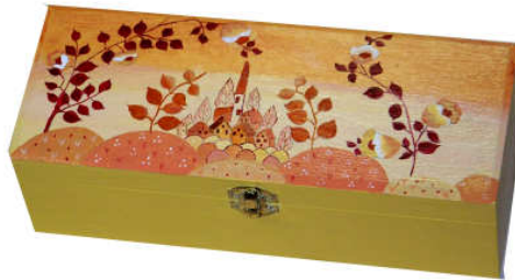
TELETHON LAZ 2013 Coffret