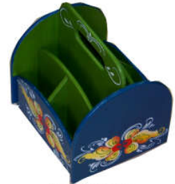
TELETHON LAZ 2013 Organisateur bureau rotatif