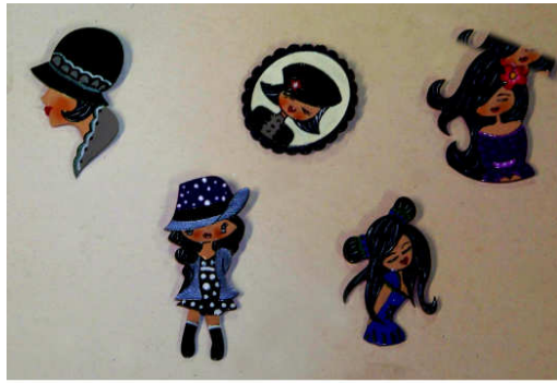
TELETHON LAZ 2013 Broches fantaisie