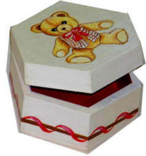
TELETHON LAZ 2013 Boîte à bijoux