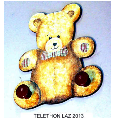
TELETHON LAZ 2013 porte-manteau pour enfant