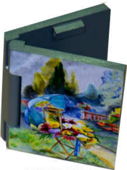
TELETHON LAZ 2013 Carnet memento