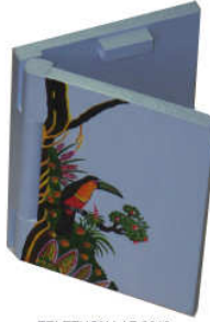
TELETHON LAZ 2013 Carnet memento