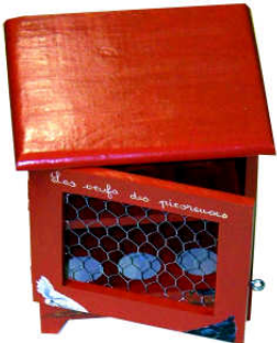
TELETHON LAZ 2013 Armoire à oufs