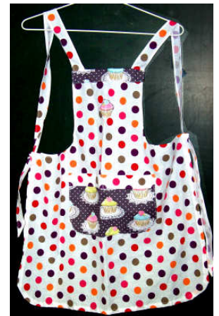
TELETHON LAZ 2013 Tablier d'enfant