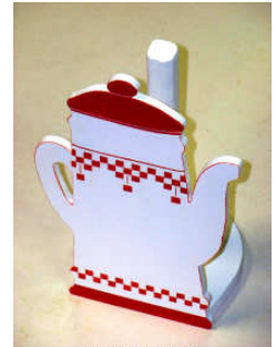
TELETHON LAZ 2013 Porte rouleau Sopalin