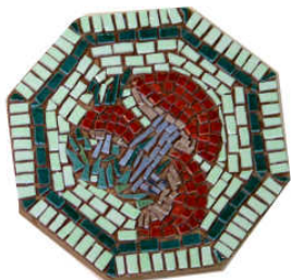
TELETHON LAZ 2013 Dessous de plat céramique