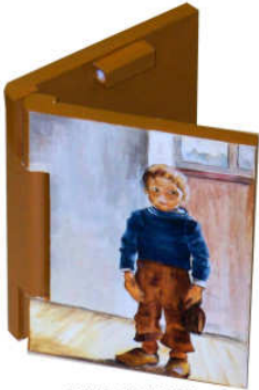
TELETHON LAZ 2013