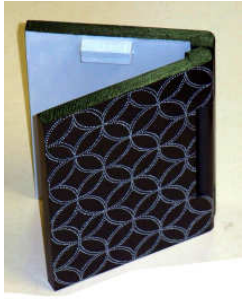
TELETHON LAZ 2013 Căminul țării