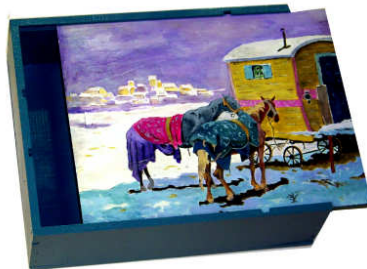
TELETHON LAZ 2013 Grand coffret