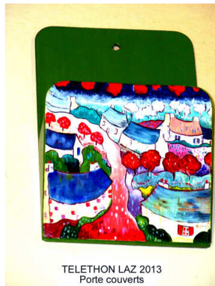
TELETHON LAZ 2013 Porte couverts