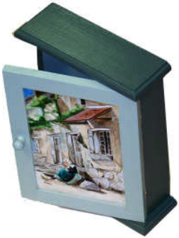
TELETHON LAZ 2013 Petite armoire à clefs