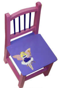
TELETHON LAZ 2013 Chaise enfant