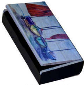
TELETHON LAZ 2013 Coffret