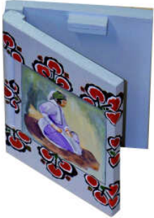
TELETHON LAZ 2013 Carnet memento