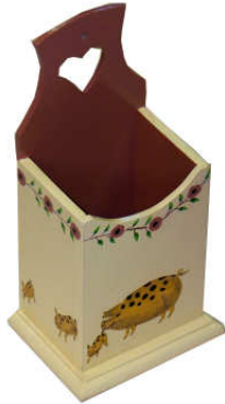
TELETHON LAZ 2013 Boîtes