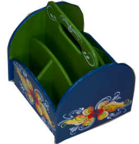
TELETHON LAZ 2013 Organisateur bureau rotatif