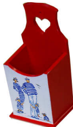
TELETHON LAZ 2013 Boîtes à couverts