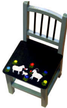
TELETHON LAZ 2013 Chaise enfant