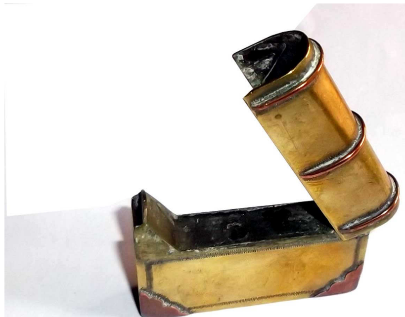
Briquet d'avuateur 1917 Douilles en cuivre repoussé et soudé Coll. Emile Le Du