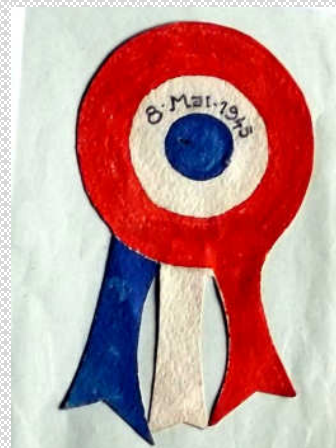
Rosette faite par les enfants des écoles en mai 1945 Coll. Emile Le Du

Ce jeune homme de 21 ans habitait Brest.