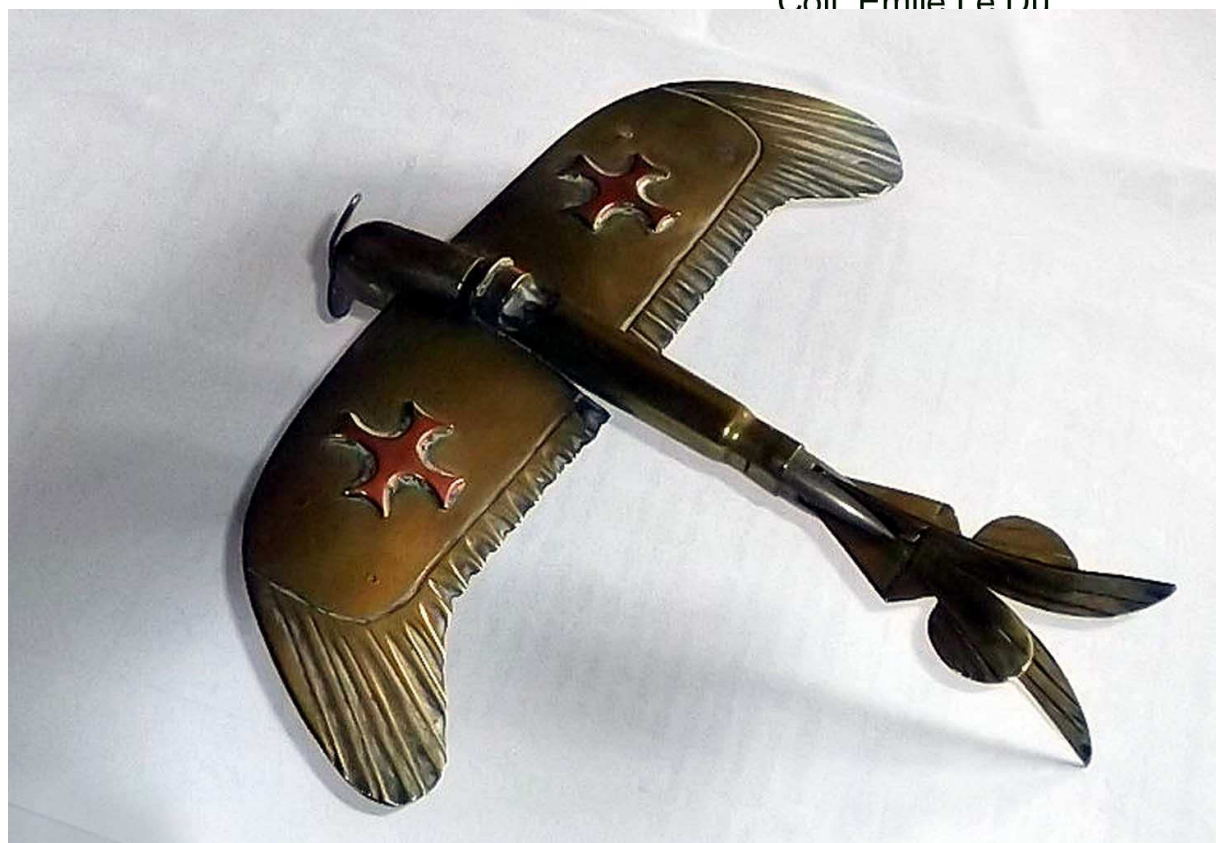
Modèle réduit avion "Taube" Cuivre repoussé et soudé à l'étain Coll. Emile Le Du