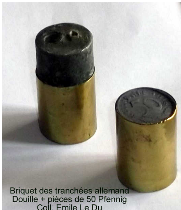
Briquet des tranchées allemand Douille + pièces de 50 Pfennig Coll. Emile Le Du

Elle comprend des objets faits par les soldats français et des travaux d'origine allemande, dont le très rare modèle, réalisé en laiton et cuivre rouge, d'avion allemand « Taube » (Colombe) utilisé au début de la guerre par les aviations austro-hongroise et allemande.