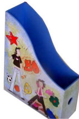
Boîte de rangement 2014-02