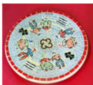
Grand dessous de plat 2014-02 "Danses"