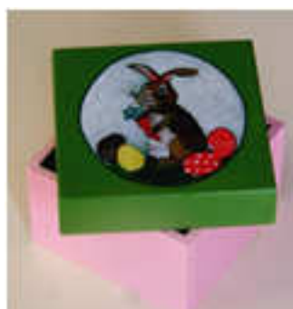
Petite boîte 2014-02