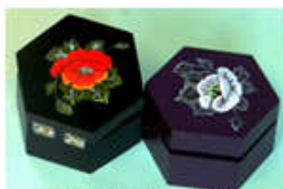
Petites boîtes 2014-07