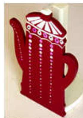
Porte rouleau Sopalin 2014-02