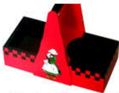
Panier à confitures 2014-01