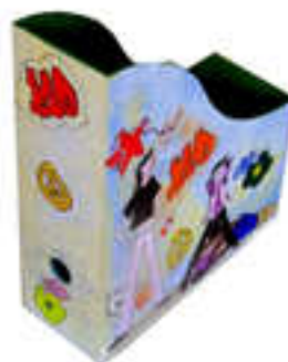
Boîte de rangement 2014-03