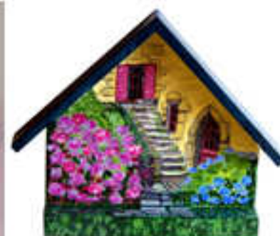
Planche à clefs 2014-01