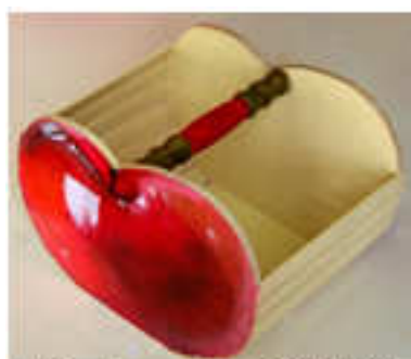
Panier pomme 2014-02