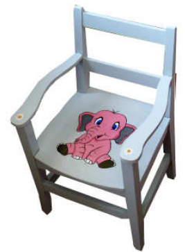
Fauteuil enfant 2014-01