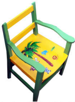
Fauteuil enfant 2014-03