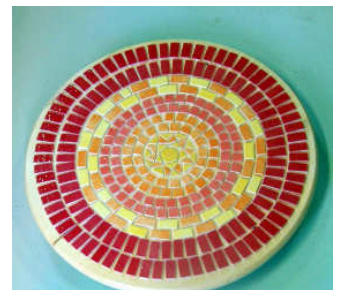
Grand dessous de plat 2014-01 "Soleil"