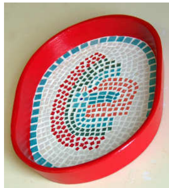
Grand plateau céramique 2014-01