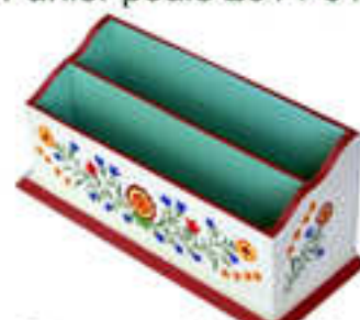
Range courrier 2014-02