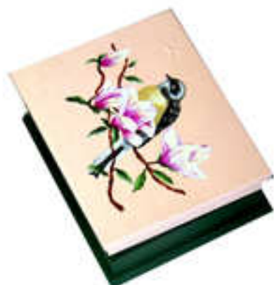
Petite boîte 2014-03