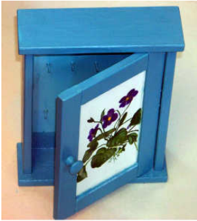
Armoire à Clefs 2014-06