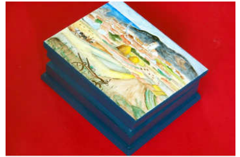
Boîte à thé 2014-01