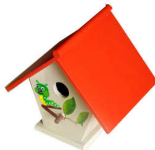
Nichoir bois 2014-01