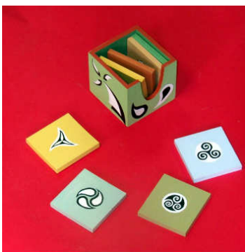
Dessous de verre 2014-01