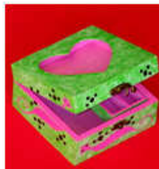
Boîte à bijoux 2014-01