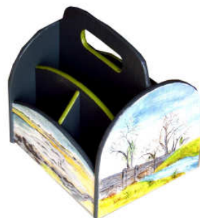
Organisateur de bureau 2014-01