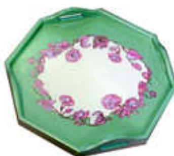
Plateau moyen 2014-01