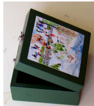
Petite Boîte 2014-01