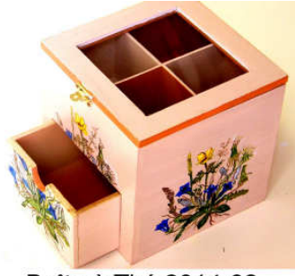
Boîte à Thé 2014-02