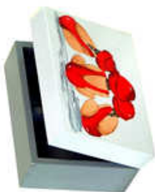
Petite boîte 2014-05