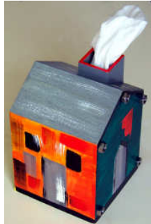
Boîte à mouchoirs 2014-03