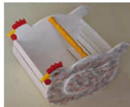
Panier poule 2014-01