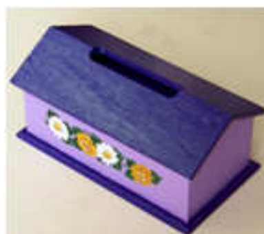
Boîte à mouchoirs 2014-02