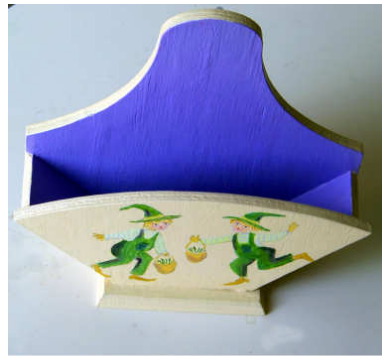
Boîte à filtres 2014-01