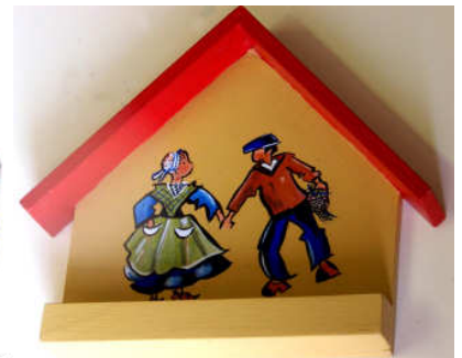
Planche à Clefs 2014-03