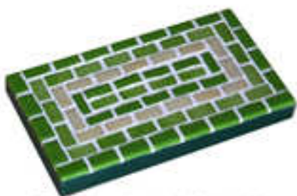
Dessous de plat 2014-02