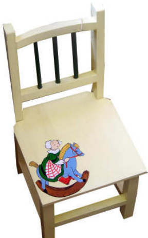
Chaise enfant 2014-02