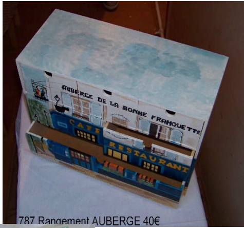
787 Rangement AUBERGE 40€