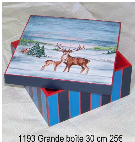
1193 Grande boîte 30 cm 25€