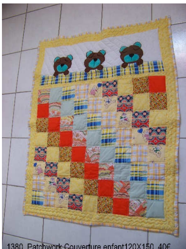
1380 Patchwork Couverture enfant 120X150 40€