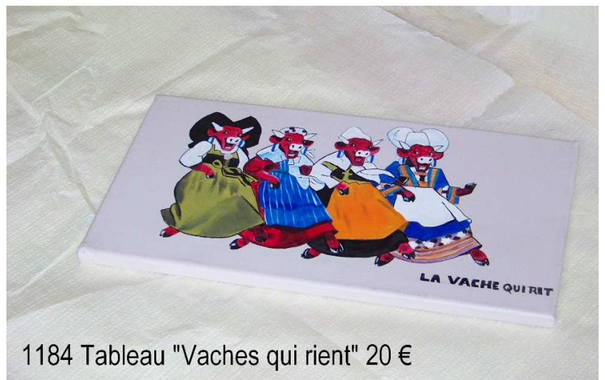
1184 Tableau "Vaches qui rient" 20 €