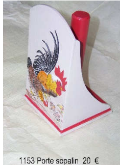
1153 Porte sopalin 20 €