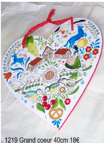
1219 Grand coeur 40cm 18€