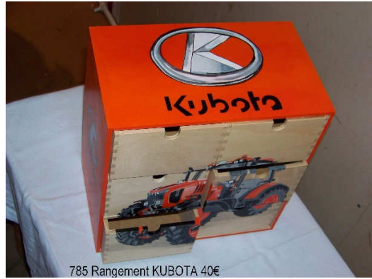
785 Rangement KUBOTA 40€