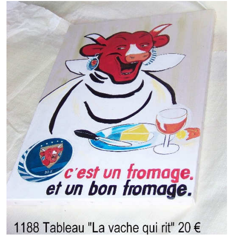
1188 Tableau "La vache qui rit" 20 €