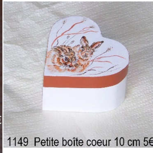
1149 Petite boîte coeur 10 cm 5€