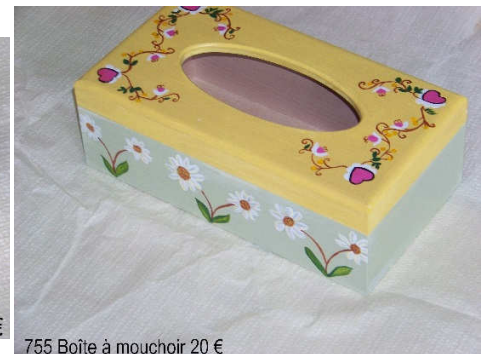
755 Boîte à mouchoir 20 €