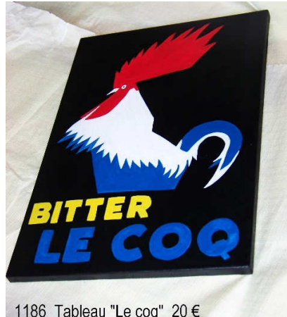
1186 Tableau "Le coq" 20 €