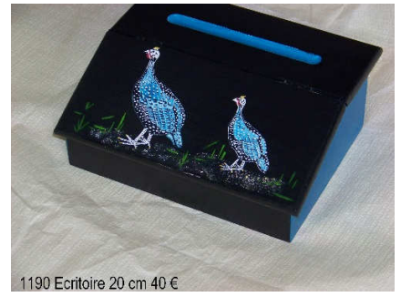
1190 Ecritoire 20 cm 40 €