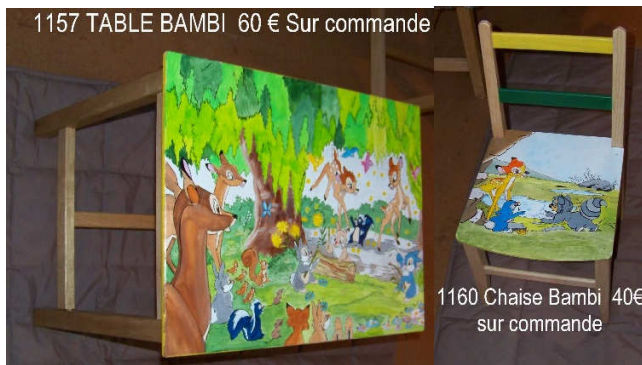
1157 TABLE BAMBI 60 € Sur commande