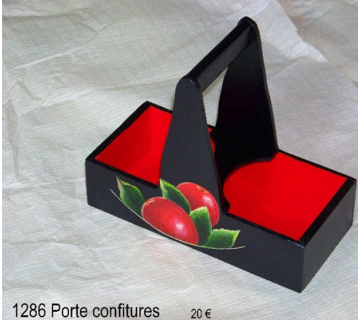
1286 Porte confitures 20 €