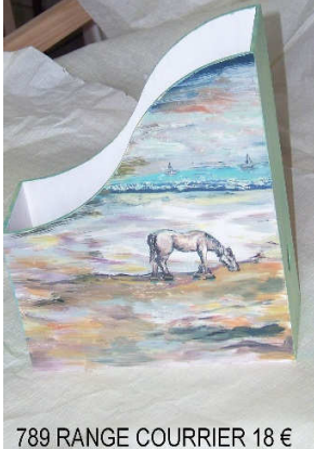
789 RANGE COURRIER 18 €