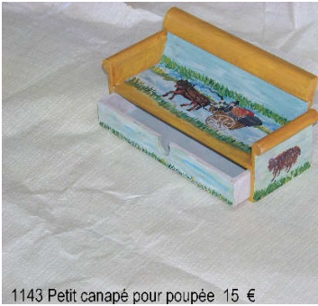
1143 Petit canapé pour poupée 15 €