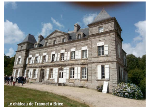
Le château de Traonet à Brieç

SA VOIX ENHARDIT LES BATAILLONS ET ENCOURAGEA LE TALENT. SA JEUNESSE APPARTINT AUX BRAVES, SON AGE MUR AU BONHEUR DE TOUS, LE SOLDAT, L'ARTISTE, L'AMI, ET SURTOUT L'ÉPOUSE, VOUDRAIENT TRACER ICI SON ÉLOGE, MAIS QUELS ACCENTS PRENDRAIT LEUR RECONNAISSANCE POUR PARLER AUSSI HAUT QUE SES BIENFAITS ?