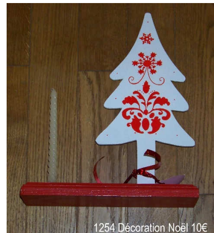
1254 Décoration Noël 10€