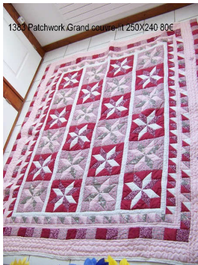
1380 Patchwork Grand couvre-lit 250X240 80€