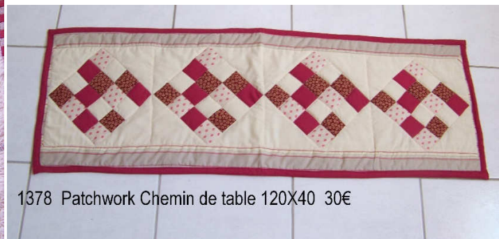
1378 Patchwork Chemin de table 120X40 30€