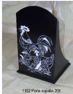
1152 Porte sopalin 20€