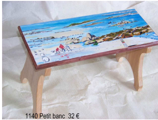
1140 Petit banc 32 €